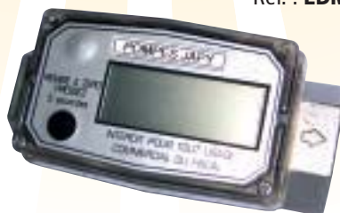
Compteur à turbine Réf. : EDMHD