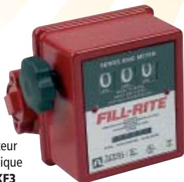
Compteur mécanique Réf. : KF3