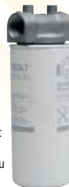
Cartouche filtrant les impuretés et absorbant l'eau Réf. : TUF460